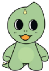
chalk smako キャラクター